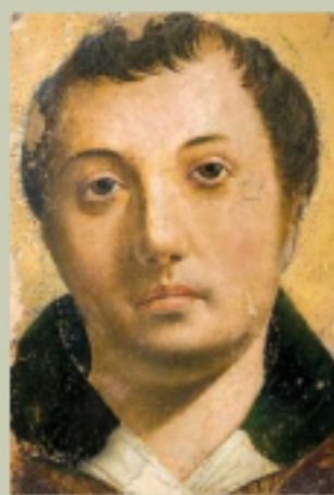
La Testa di un giovane santo di Antonello da Messina riscoperta in questi giorni

ne santo, dipinta su una tavola di pino di piccole dimensioni (30x21,5 centimetri) e datata intorno al 1476-1477, quindi successiva al ritorno dell'artista in Sicilia. Più che alla qualità pittorica, l'importanza sarebbe dovuta alla rarità: di Antonello da Messina si contano, infatti, solo una quarantina di opere sopravvissute, di cui una quindicina di ritratti e una ventina di soggetti religiosi. La scoperta di una nuova tavola rappresenta pertanto un importante incremento alla conoscenza dell'artista ritenuto colui che introdusse in Italia la pittura ad olio.