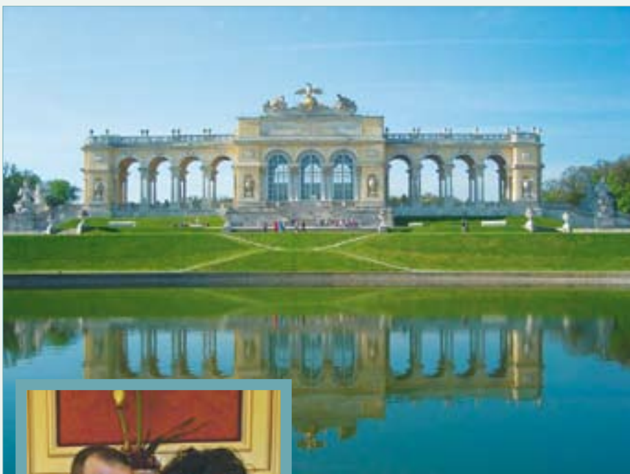
La Gloriette, en los jardines de Schönbrunn.

José I, un emperador joven y arrogante, no estaba dispuesto a aceptar la hege-